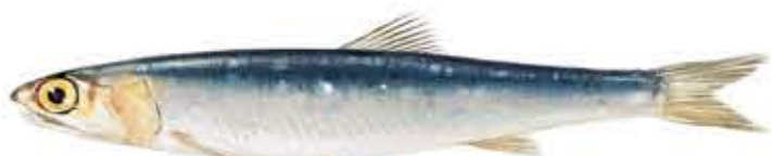
BOQUERÓN o ANCHOA Engraulis encrasicolus