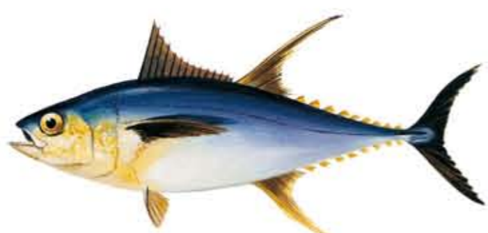
RABIL o ATÚN DE ALETA AMARILLA Thunnus albacares