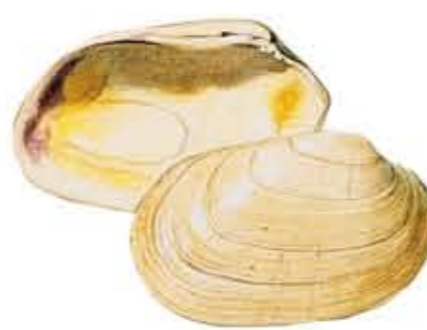
ALMEJA FINA Ruditapes decussatus