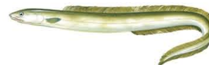
CONGRIO Conger conger