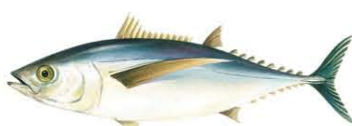
BONITO DEL NORTE o ATÚN BLANCO o ALBACORA Thunnus alalunga