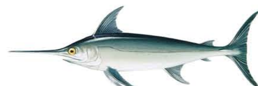
PEZ ESPADA o EMPERADOR Xiphias gladius