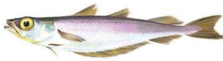
BACALADILLA Micromesistius poutassou