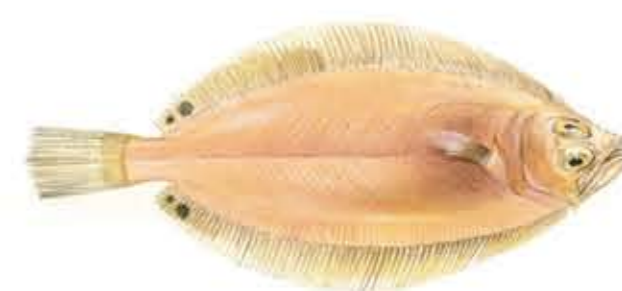
GALLO Lepidorhombus boscii