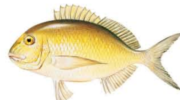
DORADA Sparus aurata