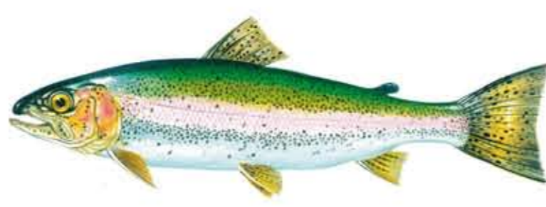
TRUCHA ARCO IRIS Oncorhynchus mykiss