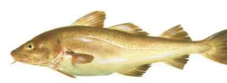
BACALAO Gadus morhua