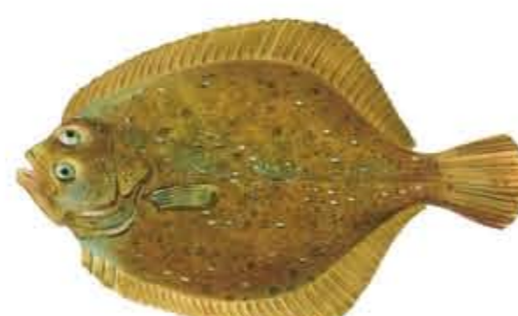
RODABALLO Scophthalmus maximus / Psetta maxima