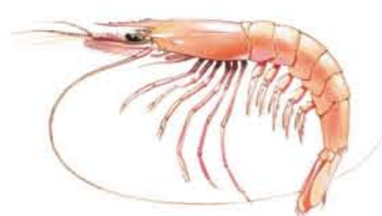
GAMBA BLANCA o DE ALTURA Parapenaeus longirostris