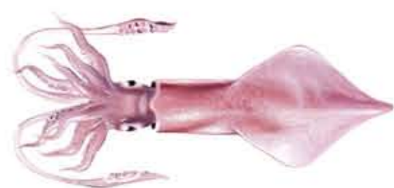
CALAMAR EUROPEO o CALAMAR Loligo vulgaris