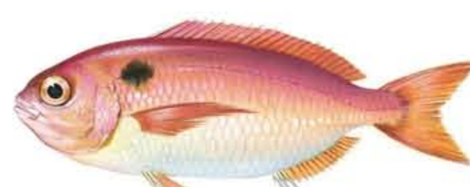
BESUGO Pagellus bogaraveo