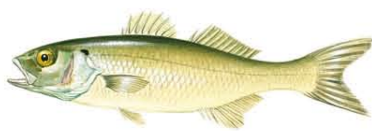
LUBINA o RÓBALO Dicentrarchus labrax