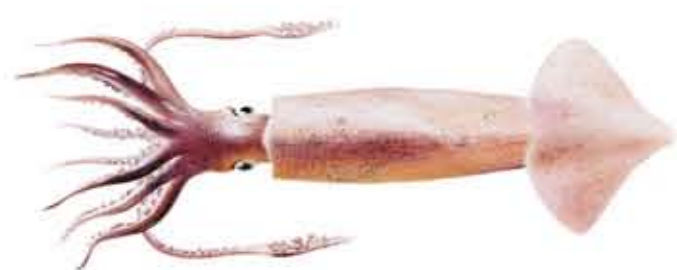
POTA Illex illecebrosus