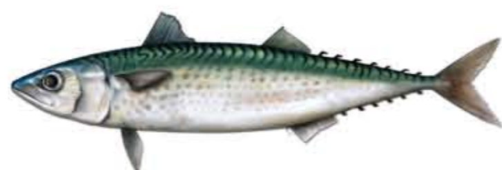
CABALLA Scomber scombrus