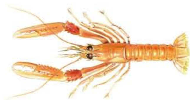
CIGALA Nephrops norvegicus