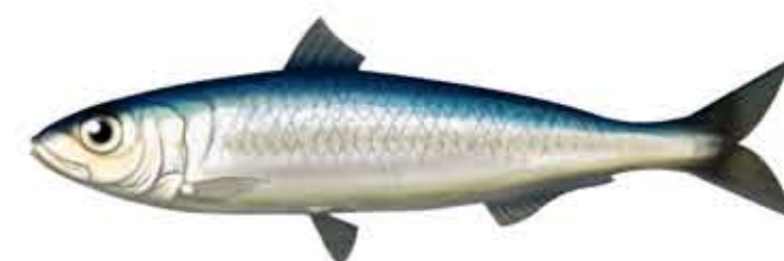
SARDINA Sardina pilchardus