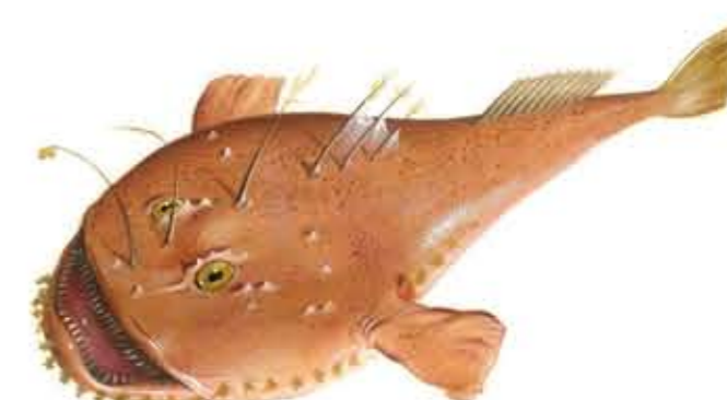
RAPE BLANCO Lophius piscatorius