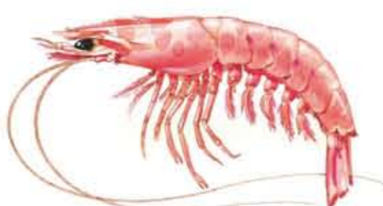
LANGOSTINO MEDITERRÁNEO Melicertus (Penaeus) kherathurus