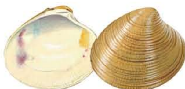
CHIRLA Chamelea gallina