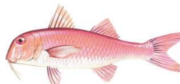
SALMONETE DE ROCA Mullus surmuletus