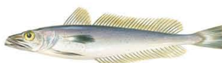
MERLUZA o MERLUZA EUROPEA Merluccius merluccius