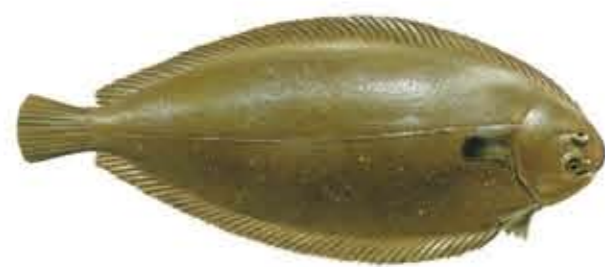
LENGÜADO EUROPEO Solea solea