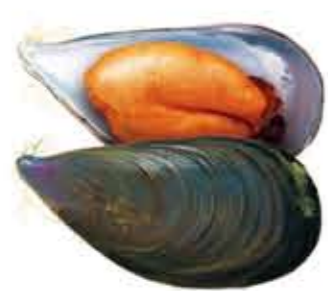
MEJILLÓN Mytilus galloprovincialis