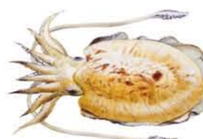
SEPIA, CHOCO o JIBIA Sepia officinalis